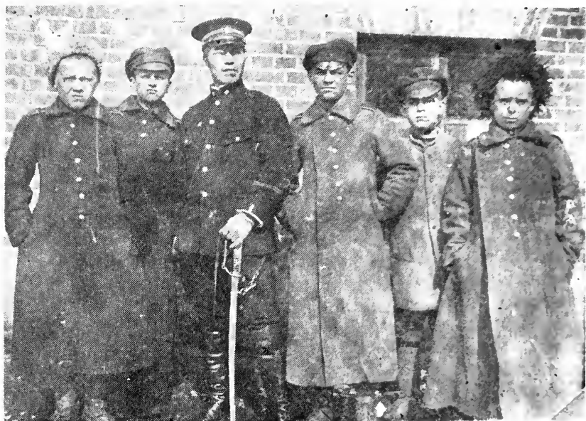
Младшие кадеты в 1922 г. в лагере в Мугдене с японским жандармом.

также-то лица приняты на службу и не будут обременять общество. С этими удостоверениями сошли на берег все: каждая группа в 25 человек, сойдя на берег, находила способ вернуть свои удостоверения обратно на корабль и ими пользовалась следующая группа и т. д. Оба корпуса, и Сибирский, и Хабаровский, были помещены вместе, в вилле одного отсутствовавшего иностранца на Джесфилд Род № 4.