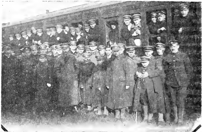
Отъезд Сибиряков в Крагуевац в конце сентября 1925 г. на слесарно-монтажные курсы.