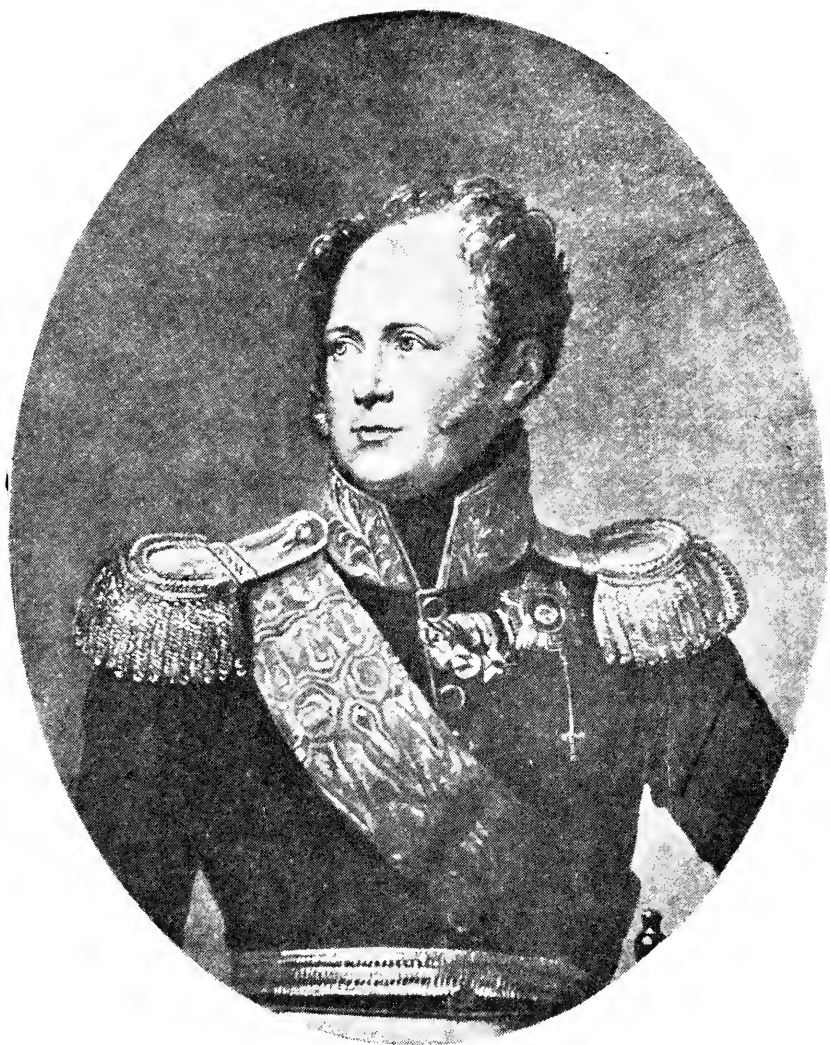
Державный Основатель Корпуса. Его Императорское Величество Государь Император АЛЕКСАНДР I