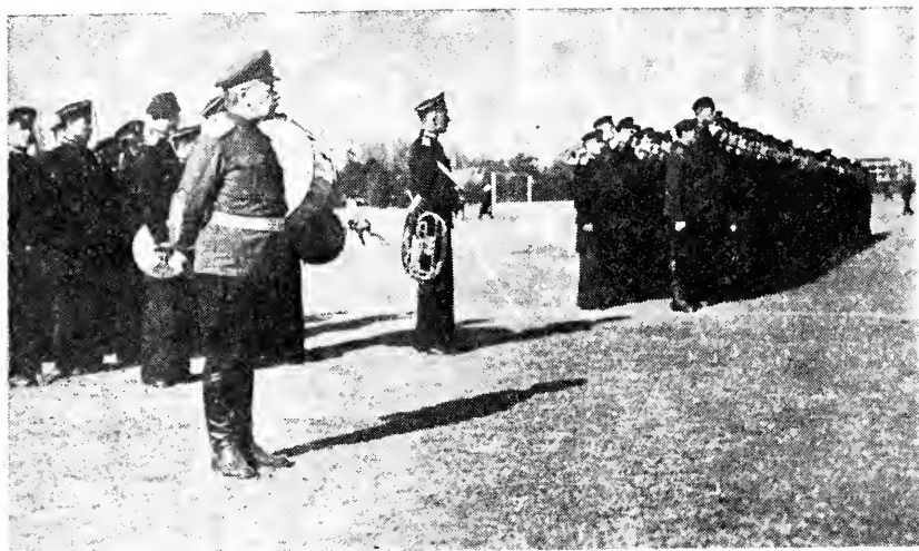
Корпусной Праздник — 19 декабря

В день корпусного праздника 6/19 декабря, после торжественного богослужения, директор ген. Руссет принял парад кадет, которые прошли перед ним церемониальным маршем, под звуки фанфар, в присутствии многих зрителей, наблюдавших за кадетами с нескрываемым любопытством и одобрением. Вечером в этот день, во французском Клубе состоялся большой бал; перед началом бала была поставлена инсценировка стихотворения кадета Морозовича «Возрождение России». Во время действия оркестр тихо исполнил национальный гимн «Боже, Царя храни!», при первых звуках которого публика заполнившая обширное помещение клуба, встала и прослушала его стоя. В концертной программе перед балом участвовали и кадеты, и видные артисты, находившиеся в то время в Шанхае. Бал привлек массу международной публики и прошел исключительно успешно.