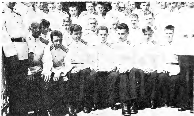
Группа со Звериადой — Шанхай 1924 г.