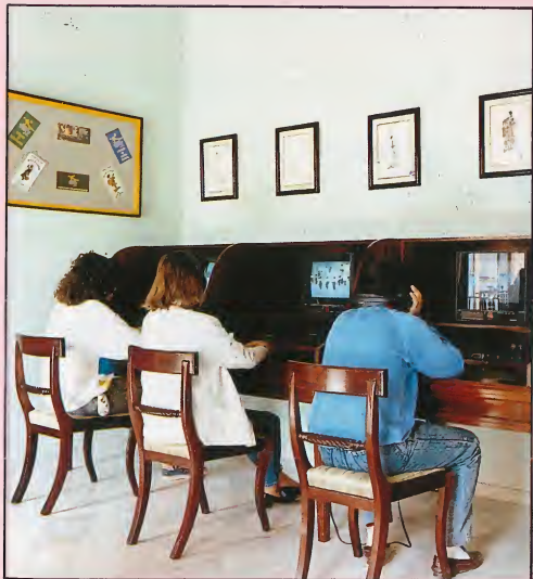
Fonoteca-Videoteca. Language Laboratory and Video Library.

Un servicio importante es constituir la Fonoteca-videoteca, utilizando las más modernas tecnologías audiovisuales —soporte digital—, el visitante puede recrearse contemplando y escuchando desde las más antiguas hasta las más modernas grabaciones flamencas. El amante del Flamenco puede obtener reproducciones de los testimonios más antiguos del canto y del baile.