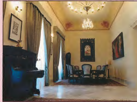
Salón Noble. One of the many beautiful salons.

The aim of the Andalusian Flamenco Foundation is to create a worldwide awareness of Flamenco Art in all its forms. The Foundation is working continually to promote this culture by offering many different services and programmes in its centre.