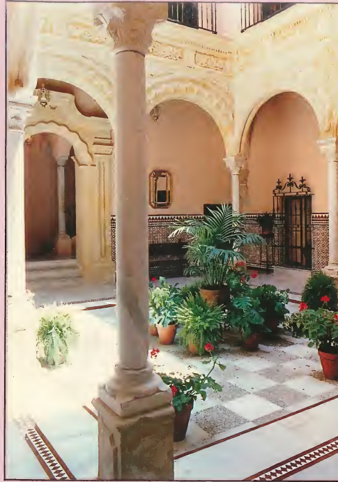
Patio principal. Siglo XVIII The main interior patio, dating from 18th century.

The Andalusian Flamenco Foundation founded its centre in Jerez, in the neighbourhood of Santiago, which is perhaps one of the most genuine areas of Flamenco in all of Andalusia. The central office is housed in the Pemartín Palace, a Palace which dates from 18th century and abounds with many artistic touches, like for example, its stuccoed Mudéjar ceiling and a beautiful stone worked interior patio. Here day after day the Foundation strives to keep the Flamenco tradition alive. We also aim to promote this unique Art to its rightful position among the great musical cultures of the world.