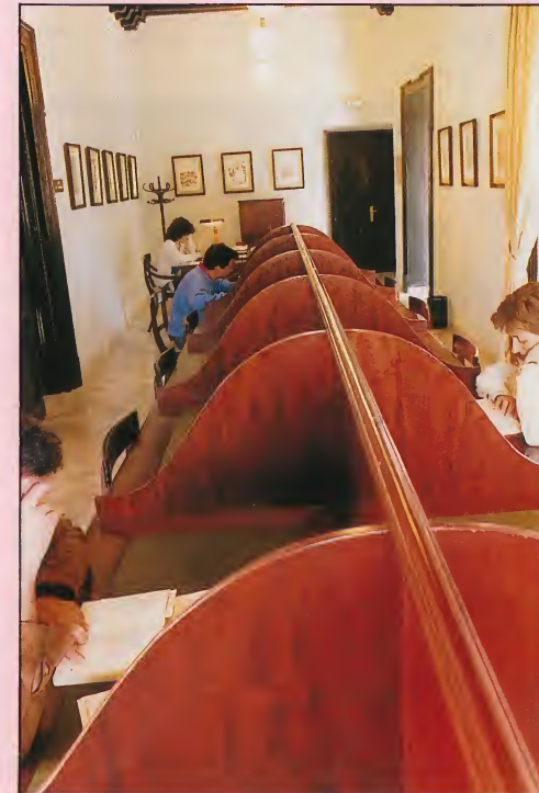
Biblioteca. Sala de lectura. Library: The Reading Room.

In our Centre you can also find approximately two thousand volumes which deal with the diverse aspects of Flamenco. This collection represents the best library of its kind to be found in all of the Andalusian region.