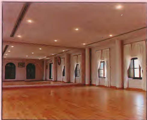
Aula de Baile. Dance Room.

Our Language Laboratory and Video Library play a very important part too. The installations are all of the most up-to-date audiovisual technology. Visitors to our Language Laboratory and Video Library can entertain themselves by watching and listening to anything from the oldest to the most up-to-date Flamenco music and dance. Anyone interested can also acquire copies of those recordings which are no longer available commercially.