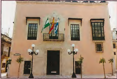
Palacio de Pemartín, Sede de la Fundación Andaluza de Flamenco Pemartín Palace. The Central Offices of the Andalusian Flamenco Foundation.

La Fundación Andaluza de Flamenco tiene su sede en Jerez, en el Barrio de Santiago, uno de los lugares más genuinamente flamenco de Andalucía. Su sede es el Palacio de Pemartín construido en el siglo XVIII, con valiosos elementos artísticos, como un artesonado mudéjar y un patio labrado en piedra. En él se realiza un esfuerzo diario por conservar toda la antigua memoria del FLAMENCO y por hacer que este ARTE único alcance el lugar luminoso que por derecho propio le corresponde entre las grandes culturas musicales del mundo.